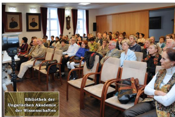
Budapest, 10. 10. 2012